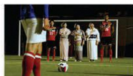
いわきFC × フラ女将

フキラウソングに乗せてフラ女将 が踊ります。フキラウとは地引き 網のこと。福島沖の漁業の復活 を願って踊ります。